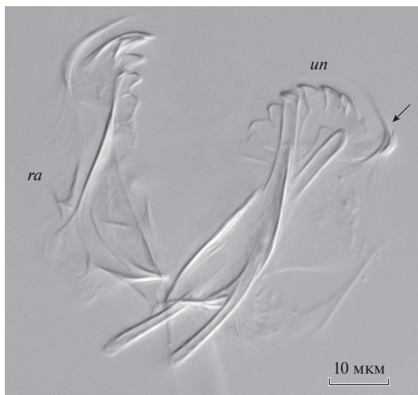
Рис. 2. Synchaeta lakowitziana – рамусы ( ra ) и ункусы ( un ). Стрелкой показан двойной фронтальный крючок.

тах (Кутикова, 1970; Hollowday, 2002; Wilke et al., 2019). В частности, Кутиковой (1970) показано, что туловище этих коловраток наиболее широкое в первой половине длины. Голова перехватом отчетливо отделена от туловища. Передний край головы пятиугольный. Нога большая, в прокси-