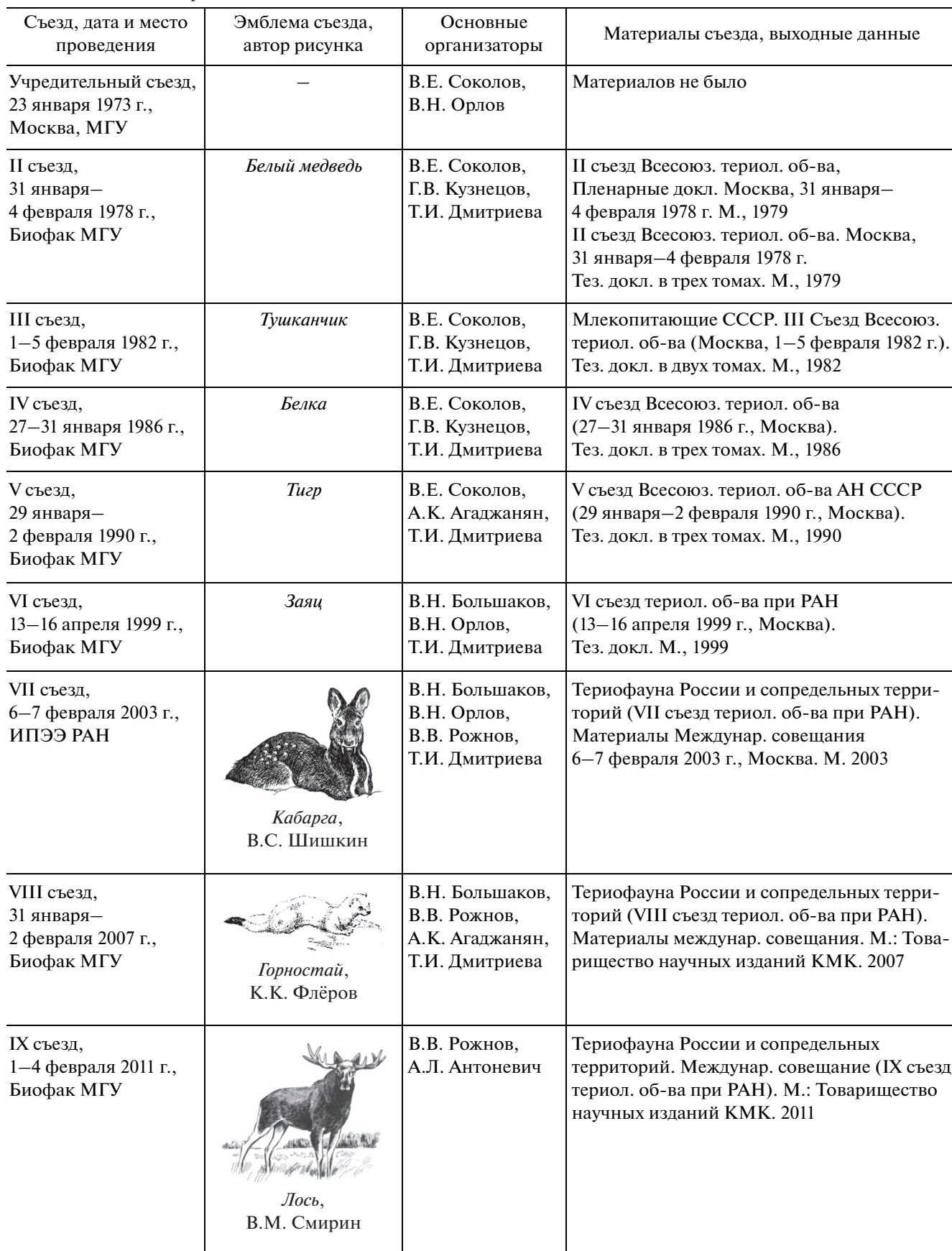
Таблица 1. Съезды Териологического общества